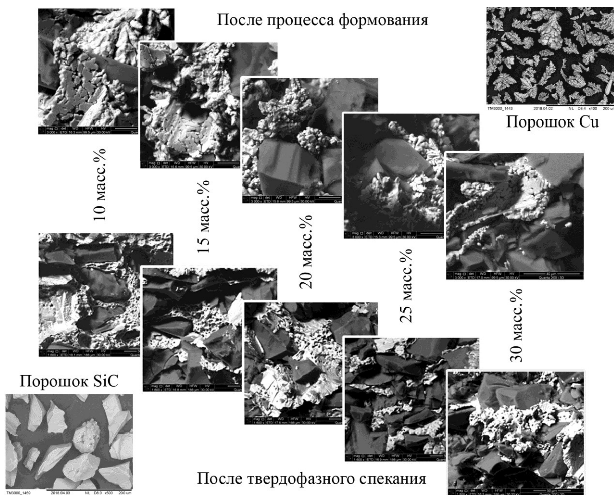
Рис. 1. Микроструктура излома ( Cu, SiC ) – порошкового тела до и после твердофазного спекания с различным содержанием карбида кремния.

обнаруживаются области с практически недеформированными частицами меди (их форма близка к соответствующей форме для исходного порошка). Данный факт обусловлен формированием жестких каркасов из частиц карбида кремния, в том числе частиц, являющихся результатом исходных что, по-видимому, связано с недостаточным давлением прессования. Такие каркасы затруднительно разрушить давлением используемым в настоящем исследовании (ограничение применяемой установки). В результате образуется пространство, в котором могут находиться частицы матричного материала. Существование данных областей способствует также частичному снятию остаточных напряжений вследствие релаксационных процессов, протекающих как в матричном материале ( Cu ), так и армирующем материалах.